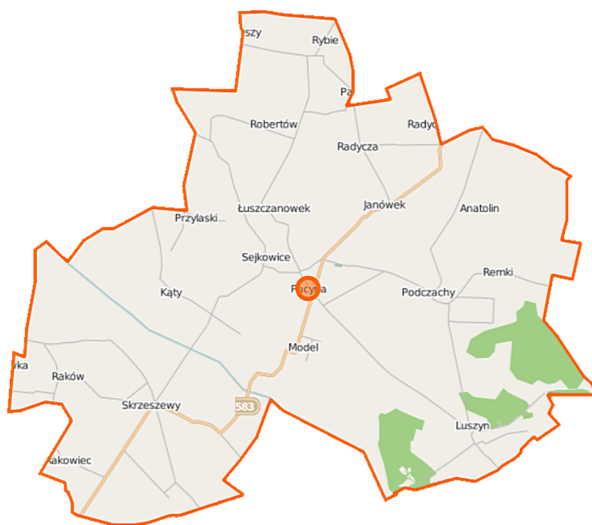
Rys. 3 Mapa Gminy Pacyna

Obszarowo Gmina zajmuje powierzchnię 90,85 km 2 i jest podzielona na 18 sołectw: Anatolin, Janówek, Luszyn, Łuszczanówek, Pacyna, Podatkówek, Podczachy, Przyłaski, Robertów, Rakowiec, Remki, Raków, Robertów, Rybie, Sejkowice, Skrzeszewy, Słomków, Wola Pacyńska.