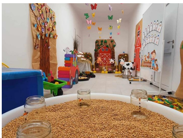
Fot. „Zagroda wiejska”(źródło własne)

Dzieci rozwijały zmysły poprzez kontakt z różnorodnymi materiałami i fakturami, co wspierało integrację sensoryczną.