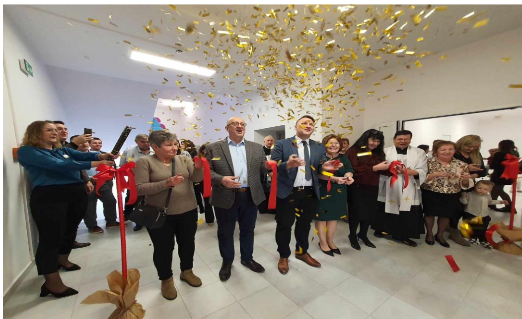
Fot. „Moment uroczystego przecięcia wstęgi – otwarcie Żłobka”

W dniu 5 lutego 2025 r. miało miejsce oficjalne otwarcie Gminnego Żłobka w Skrzyszewach, które stanowiło formalne rozpoczęcie jego działalności. Wydarzenie to było ważnym momentem dla lokalnej społeczności oraz istotnym krokiem w rozwoju infrastruktury opieki nad dziećmi do lat 3 na terenie Gminy, odpowiadającym na potrzeby mieszkańców w zakresie dostępności miejsc opieki dla najmłodszych.