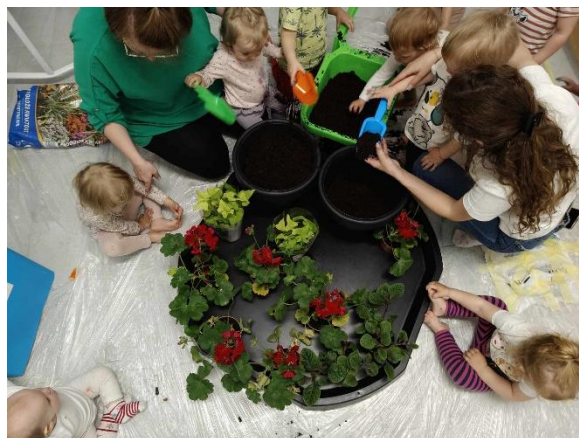
Fot. „Dzień Ziemi”(źródło własne)