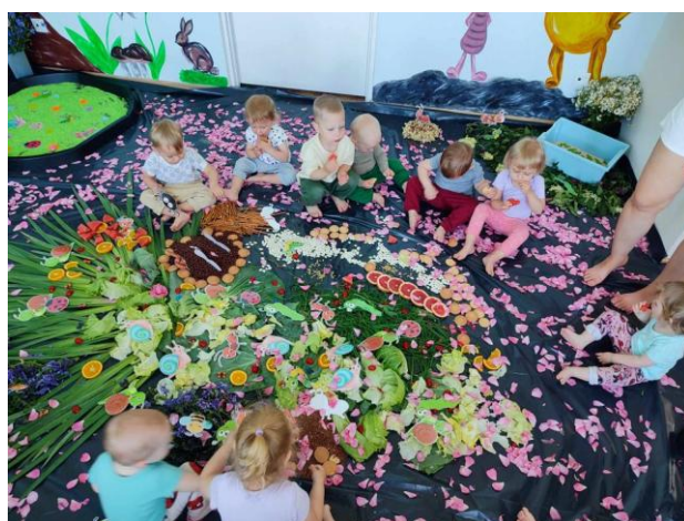
Fot. „Łąka”