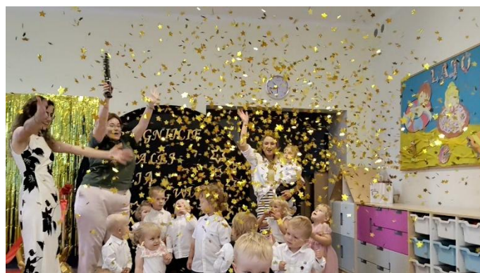
Fot. „Zakończenie roku szkolnego”(źródło własne)