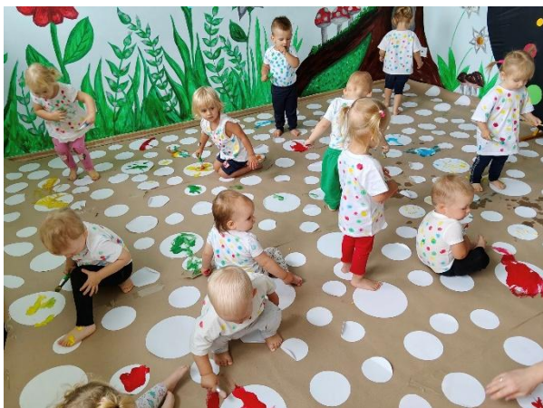
Fot. „Dzień kropki”(źródło własne)

W Żłobku realizowano szeroki zakres dni tematycznych, które stanowiły ważny element pracy edukacyjnej. Zajęcia oparte były na zabawie i doświadczeniu, umożliwiając dzieciom zdobywanie nowych umiejętności w naturalny i atrakcyjny sposób. Tematyka zajęć była różnorodna i dostosowana do możliwości rozwojowych dzieci.