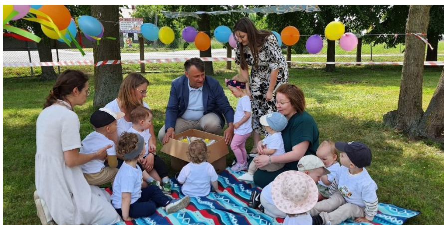
Fot. „Dzień Dziecka”(źródło własne)