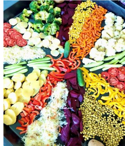
Fot. „W warzywniku”(źródło własne)