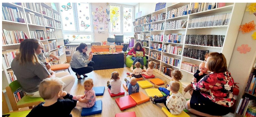
Fot. „Wizyta w Gminnej Bibliotece Publicznej w Pacynie”