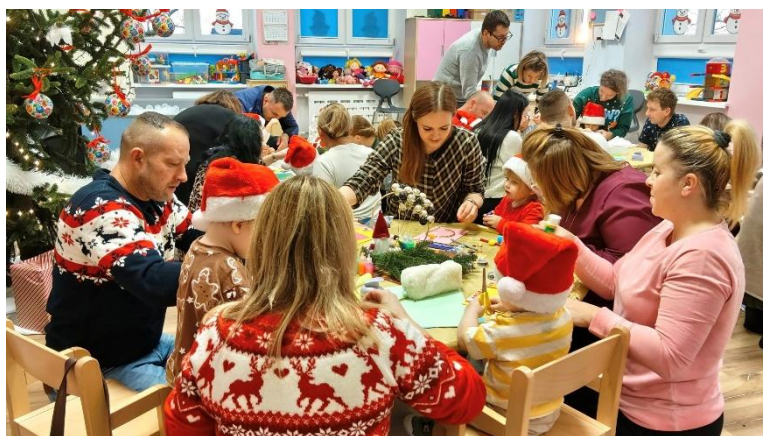
Fot. „Rodzinne warsztaty Bożonarodzeniowe” oraz „Rodzinne warsztaty Wielkanocne”(źródło własne)