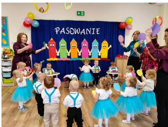
Fot. „Pasowanie”(źródło własne)

W Żłobku organizowano liczne uroczystości i wydarzenia ważne dla dzieci. Do najistotniejszych należały: „Pasowanie na Żłobkowicza”, „Biegnijcie Aleją Gwiazd- zakończenie roku szkolnego.” Obchodzono również „Dzień Dziecka” oraz święta i wydarzenia z kalendarza, takie jak „Andrzejki”, „Walentynki” czy „Sylwester”. Wszystkie wydarzenia miały charakter edukacyjny i integracyjny.