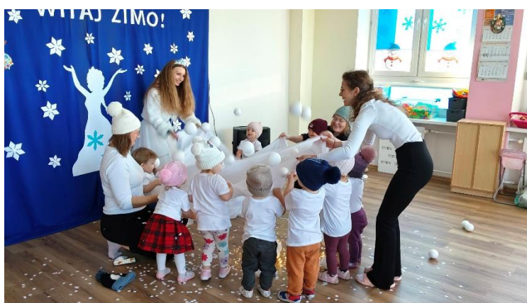
Fot. „Pory roku”