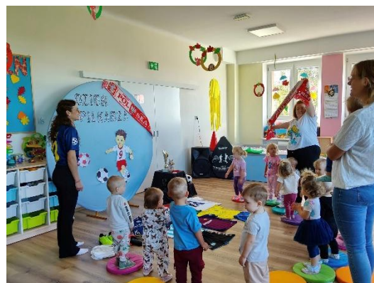
„Dzień Piłkarza”