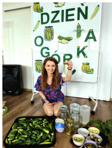
Fot. „Dzień ogórka”