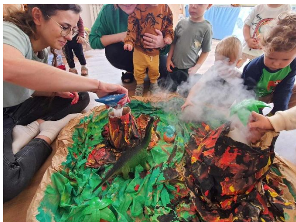
Fot. „Dzień Dinozaura”(źródło własne)