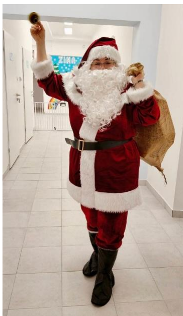
Fot. „Mikołajki”(źródło własne)

Fot. „Święto Niepodległości 11 listopada”(źródło własne) Fot. „Karnawał”(źródło własne)