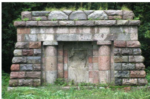
Fotografia 9 Pamiątkowy Pomnik żołnierzy niemieckich w Luszynie