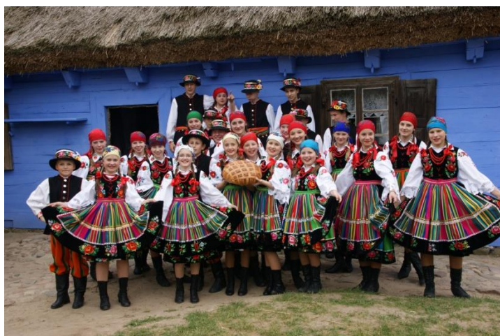
Fotografia 3 Dziecięcy Zespół Ludowy Pieśni i Tańca z Pacyny