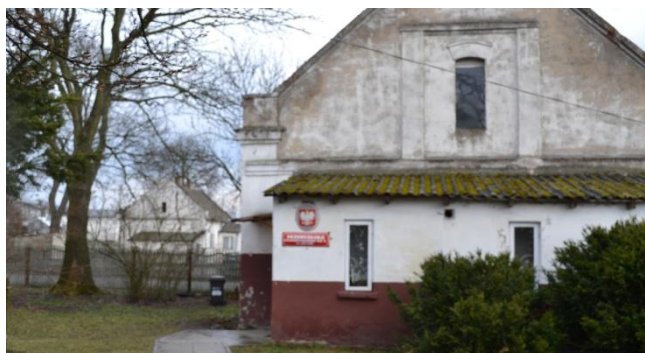
Fotografia 12 Oddział Przedszkolny w Luszynie

Na terenie miejscowości Luszyn, według danych z Powiatowego Urzędu Pracy w Gostyninie zarejestrowanych jest: