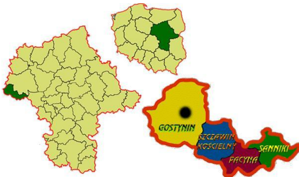
Rysunek 1 Gmina Pacyna na tle kraju, województwa mazowieckiego, powiatu gostynińskiego

Poprzez zachowanie sieciowej, ciągłej struktury tworzą tzw. "korytarze ekologiczne" pozwalające na przemieszczanie się w przestrzeni zwierząt i roślin, nie dopuszczając do izolacji poszczególnych, najwartościowszych obiektów przyrodniczych - parków narodowych, krajobrazowych oraz rezerwatów przyrody. Izolacja tych najcenniejszych terenów prowadzi do ich degeneracji z braku naturalnej wymiany genów.