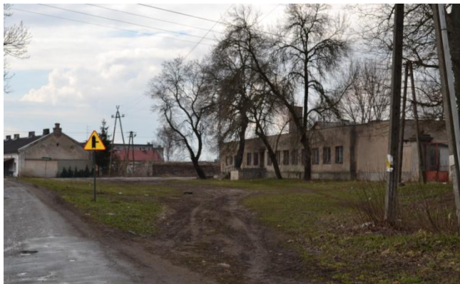
Fotografia 1,2 Widok centrum Luszyna