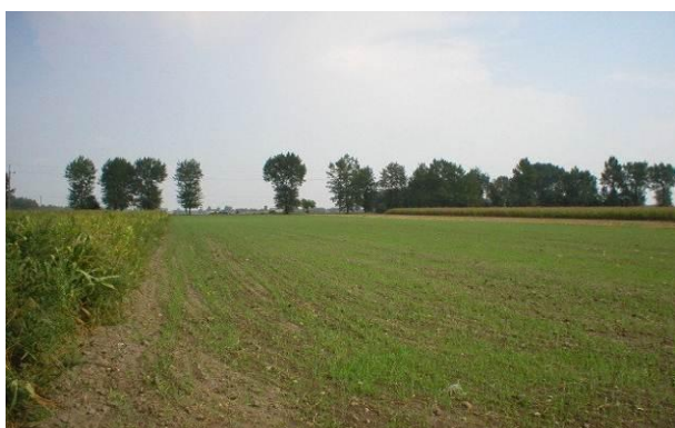
Grunty orne w Luszynie