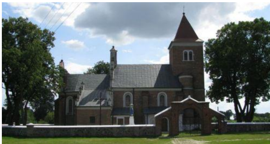
Fotografia 6,7 Widok na Kościół p.w. św. Stanisława